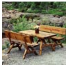
Våre hagemøbler i flatskåret plank

Vårt snekkerverksted tilbyr faglig ekspertise til å utvikle produkter. Dette innebærer at ved å gi oss en utfordring, vil vi finne kreative løsninger på produksjon av ordrer for kunder som trenger assistanse.