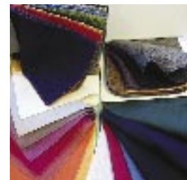
Vi har et bredt utvalg av møbeltekstiler, også brannhemmende tekstiler.

Møbeltapetsering er et viktig arbeidsfelt for oss. Med dyktige fagfolk og et allsidig produksjonsutstyr kan vi fornye møbler for både institusjoner, kommunale bygg og private kunder. I nært samarbeid med vår snekkeravdeling foretar vi også totalrenovering av møbler.