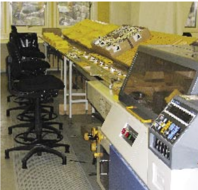
Pakkemaskin med samlebånd