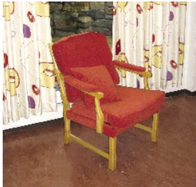
Arbeider utført av oss, Åseralshimmen